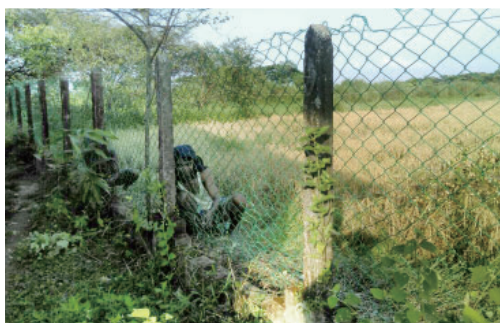
校舎回りフェンス補修