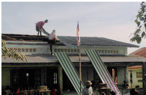
建物屋根修理風景